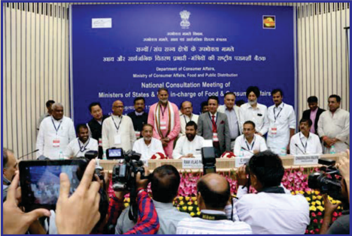
राष्ट्रीय परामर्शी बैठक, 2015 में केन्द्रीय उपभोक्ता मामले, खाद्य एवं सार्वजनिक वितरण मंत्री श्री राम विलास पासवान राज्यों के खाद्य, नागरिक आपूर्ति एवं उपभोक्ता मामलों के प्रभारी मंत्रियों के साथ